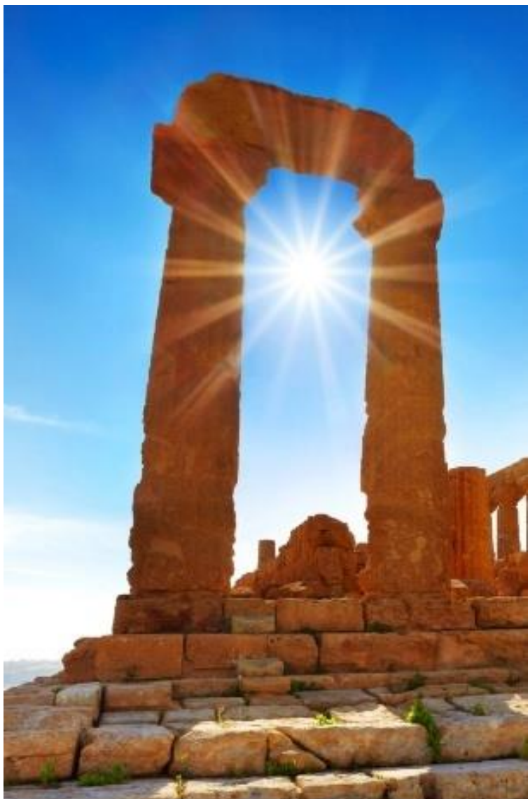
Héřin chrám v Údolí chrámů, Sicílie, poblíž Agrigenta.