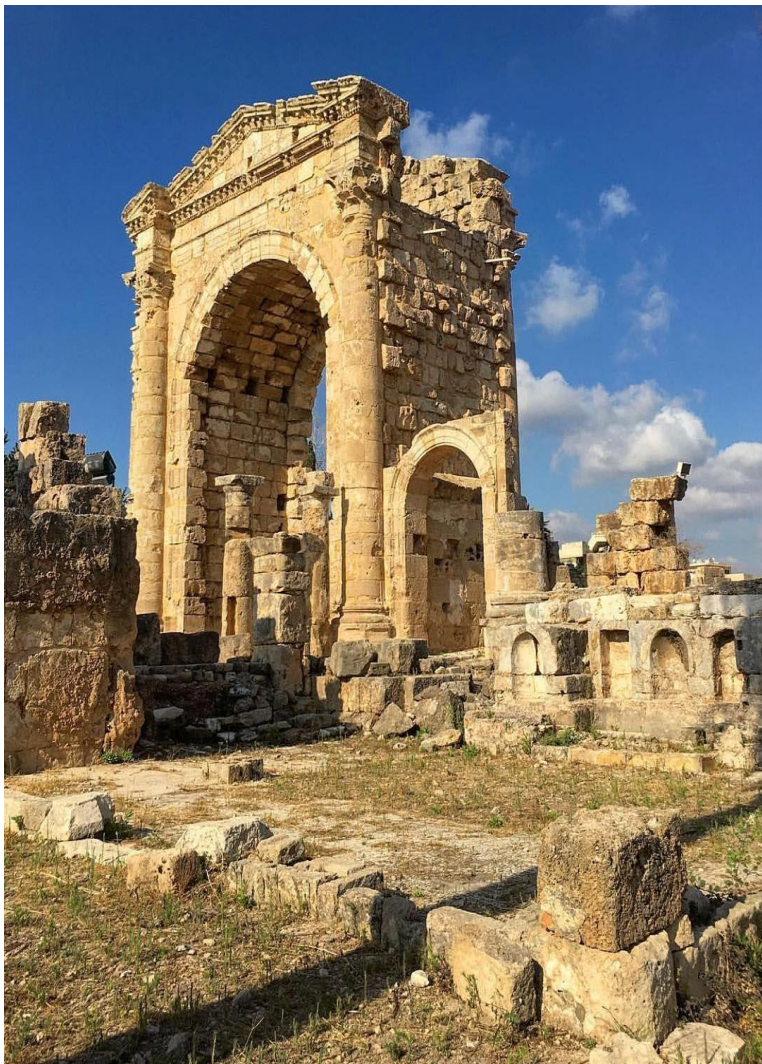
Triumfální oblouk v Týru